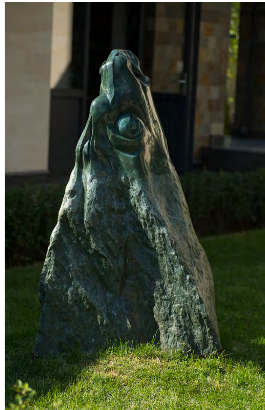
Хранитель. Материал: нефрит. Высота: 1200 мм ← Фрагмент