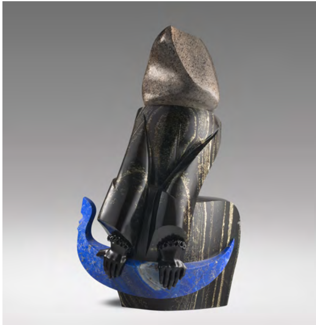
Венеция. Материалы: филлит, лазурит. Высота: 463 мм