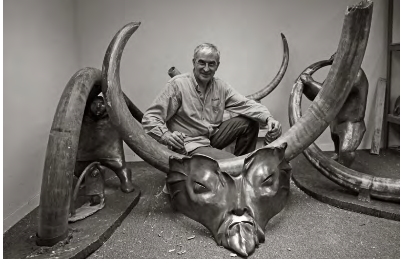
Перед выставкой «Baby mammoth of Ice Age», Гонконг. 2012 год