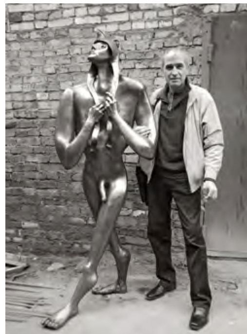
Выполненная скульптура «Петух» из серии Шествие ряженных для I Биеннале французских скульпторов. Сергей Фалькин