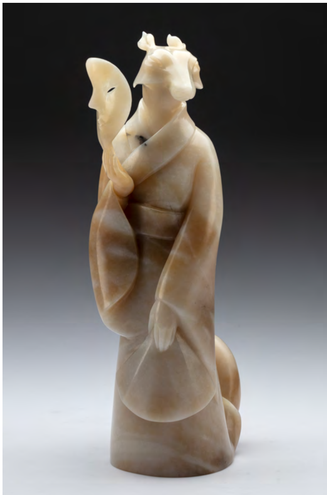
Инари. Материал: нефрит. Высота: 220 мм → Фрагмент