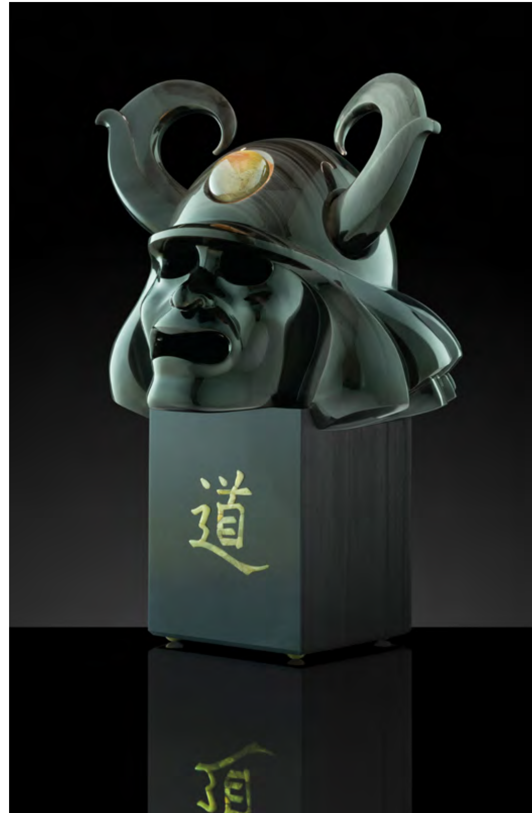
↑ Дух самурая. Материалы: обсидиан, рутиловый кварц, фианиты, копал, сталь. Высота: 405 мм ← Фрагмент