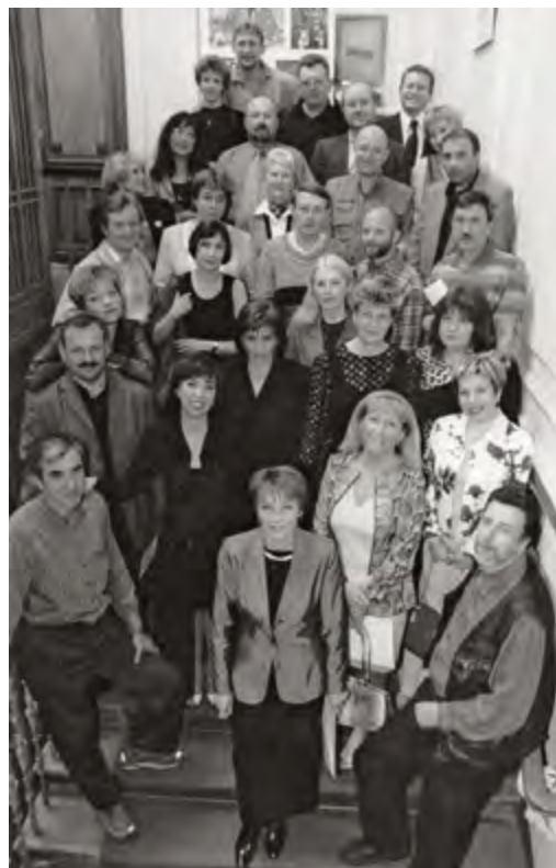
Встреча однокурсников. 2002