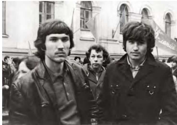
Студенты 2 курса факультета журналистики на демонстрации 7 ноября. Ленинград