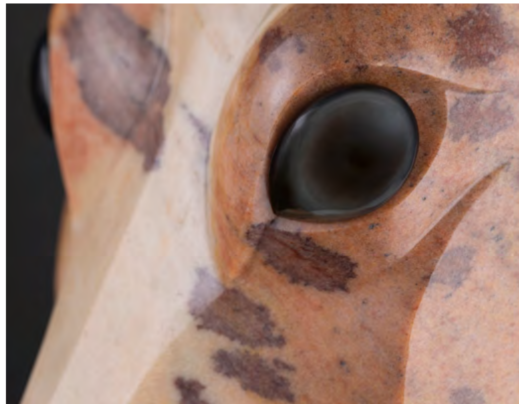
← Саванна. Материалы: авантюрин, обсидиан, кованное железо. Высота: 1085 мм ↑ Фрагмент