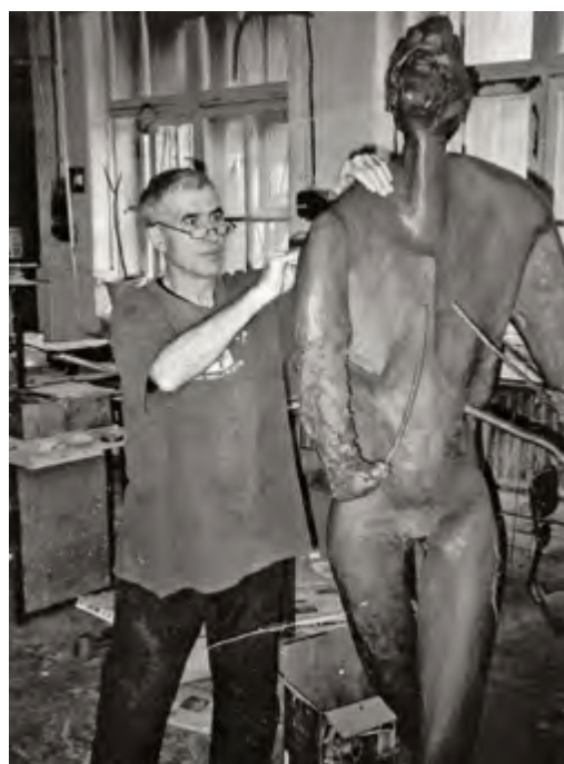
Лепка скульптуры для участия в I Биеннале французских скульпторов. 2008