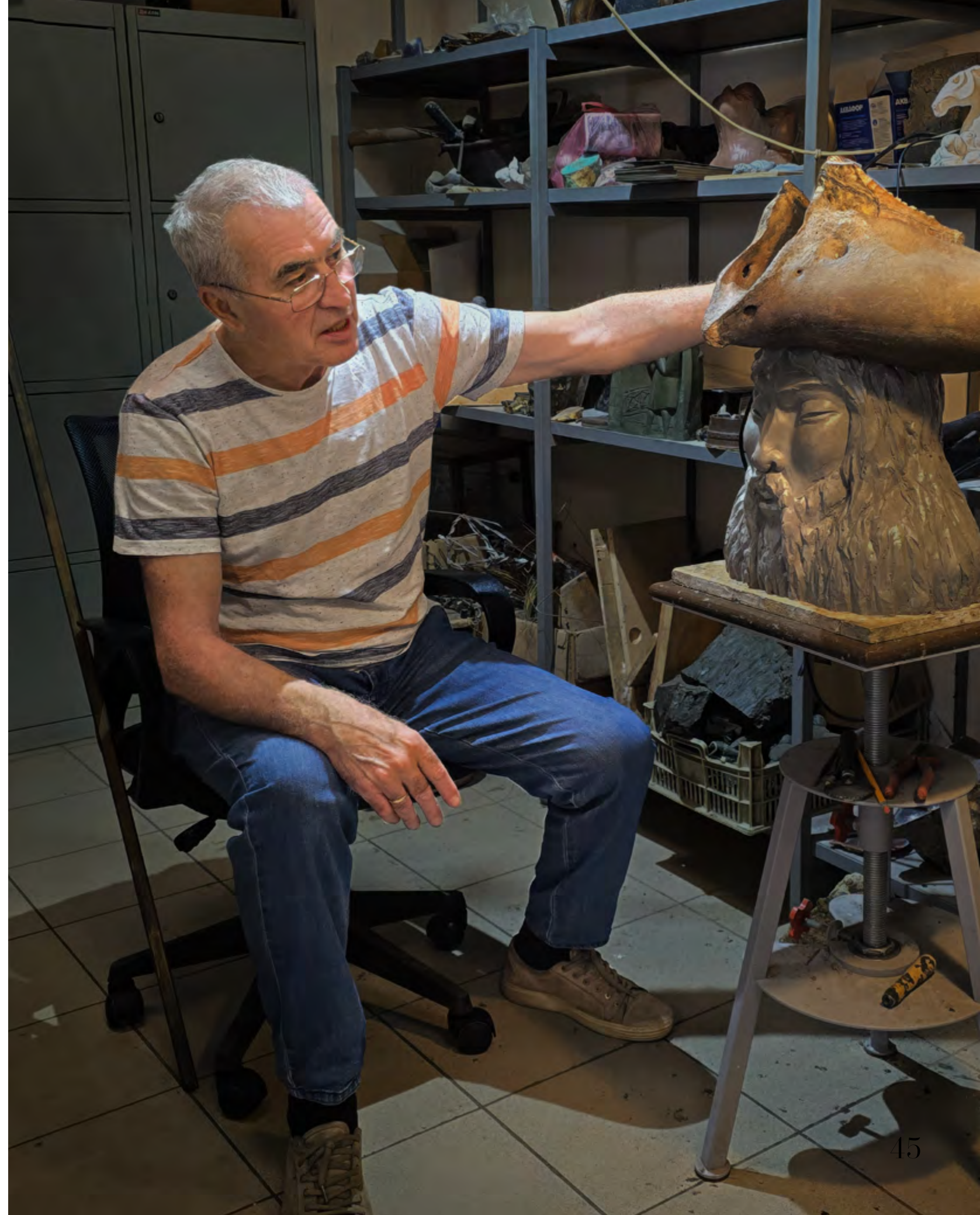
АРТ НАСЛЕДИЕ / 3 2025 / ПРИЛОЖЕНИЕ