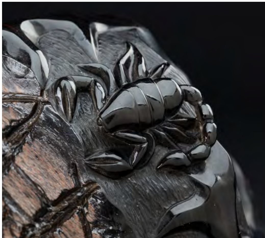
→ Жажда. Материал: обсидиан. Длина: 225 мм ↑ Фрагмент