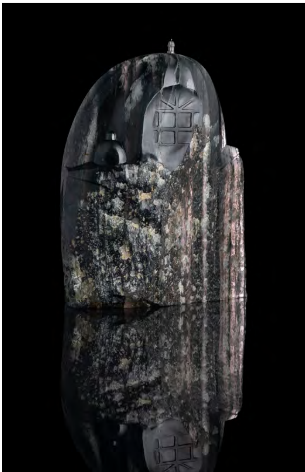
Дождь на Мойке. Материал: зеленый кварц. Высота: 275 мм