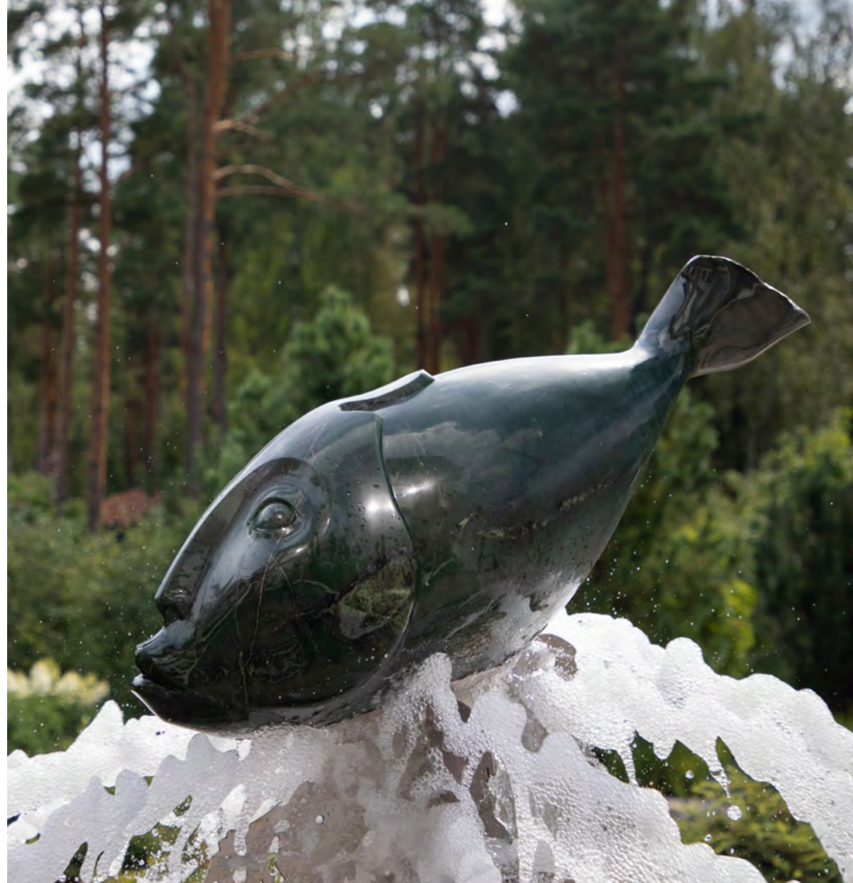
На гребне. Материалы: нефрит, кованный металл. Длина камнерезной части: 1000 мм С. 42–43 Древо памяти. Мемориал в Акулинино, Московская область